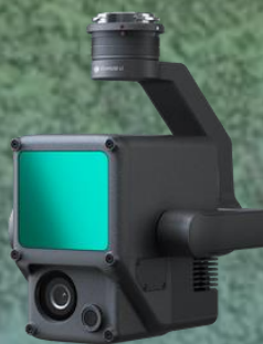
航空測量用 LiDAR + RGB ソリューション ZENMUZE L1