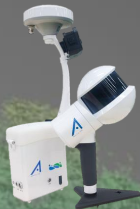
GNSS 付きハンドヘルド LiDAR スキャナ GS-1