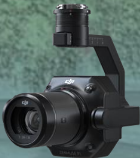
航空測量用フルサイズカメラ ZENMUZE P1