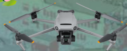
コンパクトで高性能 Mavic 3 ENTERPRISE