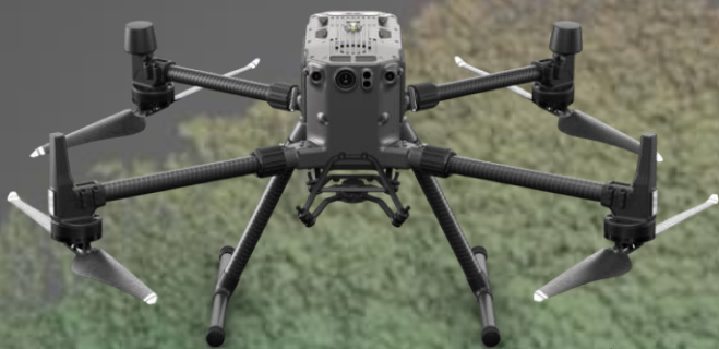
業務用ドローンの新スタンダード MATRICE 300 RTK