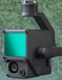
航空測量用 LiDAR + RGB ソリューション ZENMUZE L1