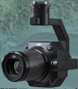
航空測量用フルサイズカメラ ZENMUZE P1