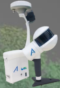
GNSS 付きハンドヘルド LiDAR スキャナ GS-1