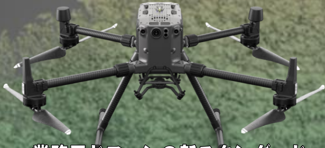
業務用ドローンの新スタンダード MATRICE 300 RTK