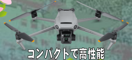
コンパクトで高性能 Mavic 3 ENTERPRISE